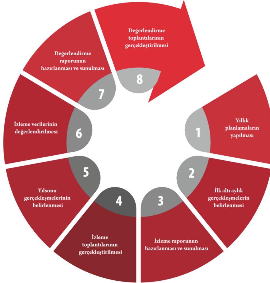
Şekil 2. İzleme Değerlendirme Süreci